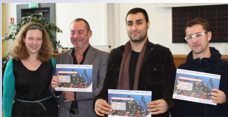
Les Niveaux 3 fraîchement diplômés :